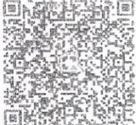
คิวอาร์โค้ด โอนเงิน