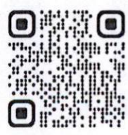
QR Code รายละเอียดฝึกอบรม

จึงเรียนมาเพื่อโปรดพิจารณาอนุเคราะห์และขอขอบพระคุณมา ณ โอกาสนี้