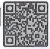
แบบฟอร์มสมัคร