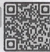
แบบฟอร์มสมัคร