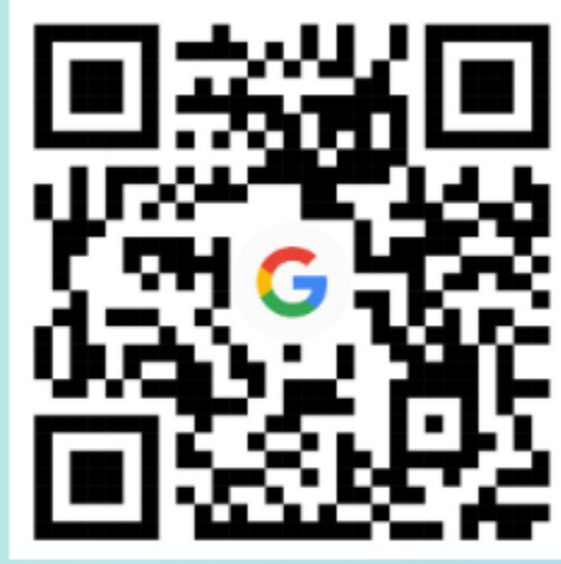
อัตราที่ 2