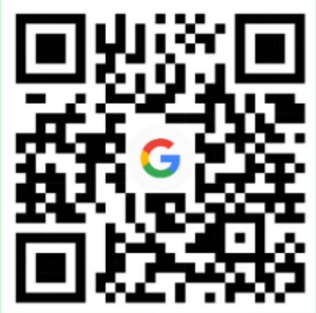
อัตราที่ 1

รับสมัครตั้งแต่วันที่นี้เป็นต้นไป ประกาศ ณ วันที่ 17/10/2566