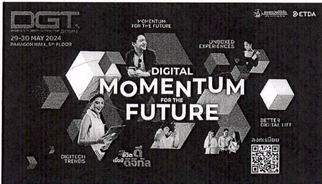
ตัวอย่าง Banner ประชาสัมพันธ์งาน DGT2024