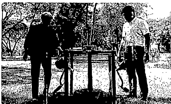
Launching the Resilient Urban Centres and Surrounds program in Bangkok, Thailand