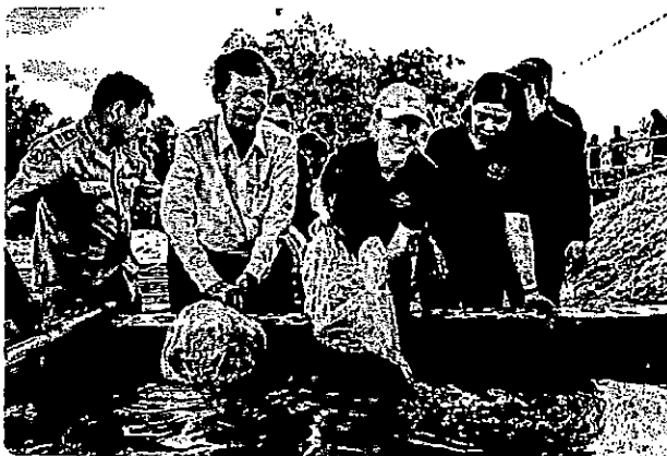
Supporting Innovation in fisheries in Cambodia

MAP is integral to building relationships, as well as sharing knowledge and skills for sustainable development and economic resilience. MAP works alongside Australia's other programs in Southeast Asia, including Partnerships for Infrastructure, and with other development partners including multilateral and civil society organisations.