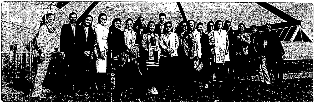
MAP Female Entrepreneurship short course for Cambodia